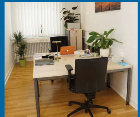
Start-up-Büros speziell für Existenzgründer/-innen

Die für alle ansässigen Unternehmen nutzbare Infrastruktur, ein vielfältiges Service- und Beratungsangebot sowie unser Netzwerk, bieten beste Voraussetzungen für unternehmerische Erfolge.